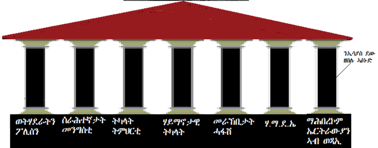
ንውልቀ መላሽ ኢሳያስ ደገፈን ደው አበለንኦ ዘለዎ ዓንድታት