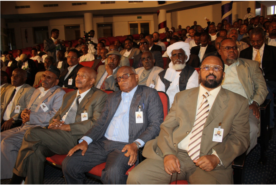
አብ ኣዲስ አበባ ዝተኻየደ ሃገራዊ ዋዕላ ዝተሳተፉ ኤርትራውያን