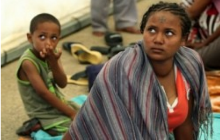
ሓበሬታ ብተወሰኺ የረድእ።

እቲ ብ EveryOne ዝወጸ ሓበሬታ ከምዘረድኦ፡ 8 ኤርትራውያን ተቆጥሎም፡ 4 ድማ ሃላዎቶም ጠፊአም አለዉ። ናቶም ስደተኛታት፡ ክፍሊ አካላት (organ) ንግዳዊ ስርሓት ውዒሉ ዝብል እምነት ከምዘሎ የርድእ። አብኡ ምስ ቁልዓኦ ዘላ ሓንቲ አደ ብተደጋጋሚ ከምተዓመጸትን ከምዝተገርፈትን ብዙሓት ካለኦት ድማ ርእሰ ቅትለት ከምዝሓሰቡን እቲ