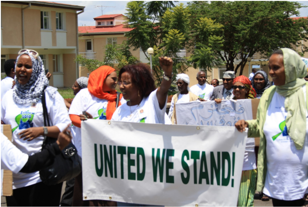
ተሳታፊዎች ደቀ እንስትዮ አብ ሃገራዊ ዋዕላ