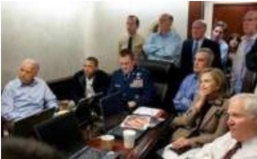
ፕረዘቶንን አባማ ምስ ሊዕሆምት ሰበሰሌጣን ኣሜሪካ ነቲ መጥቃዕቲ ብቐጽታ እንጻይ ተዲጡ

ብሰንበት ዴሕሪ ቀትሪ፡ (አብ ፓኪስታን ሰዒት 1:30 ክሳብ ሰዒት 2:00 ናይ ወጋሕታ ዜኸውን) ምዃኑ እዩ፡ ፕረዘቶንን አባማ፡ ሓሊፊት ጉዲይት ወጻኢ፡ ሂሆሪ ክሉኑትን፡ ሓሊፊ ምክሊኻሌ፡ ሮበርት ጌትስ፡ አማካሪ ናይ ሃገራዊ ዴሕነት ቶም ድኒልን ከምኡውን አማካሪ ጸረ ግብረ ሽበራ ጆን ብረናን ካሆኡትን ትይኖም ነቲ መጥቃዕቲ ክውሰዱ ክል፡ ብቐጽታ ዜመሓሊሆፊልም ዜነበረ፡ ብጻጪንቐ ወጥሪ ሐሳባት ነቲ መጥቃዕቲ ኣብ ዋይት ሃውስ ትይኖም ይከታተሉዎ ነይሮም።