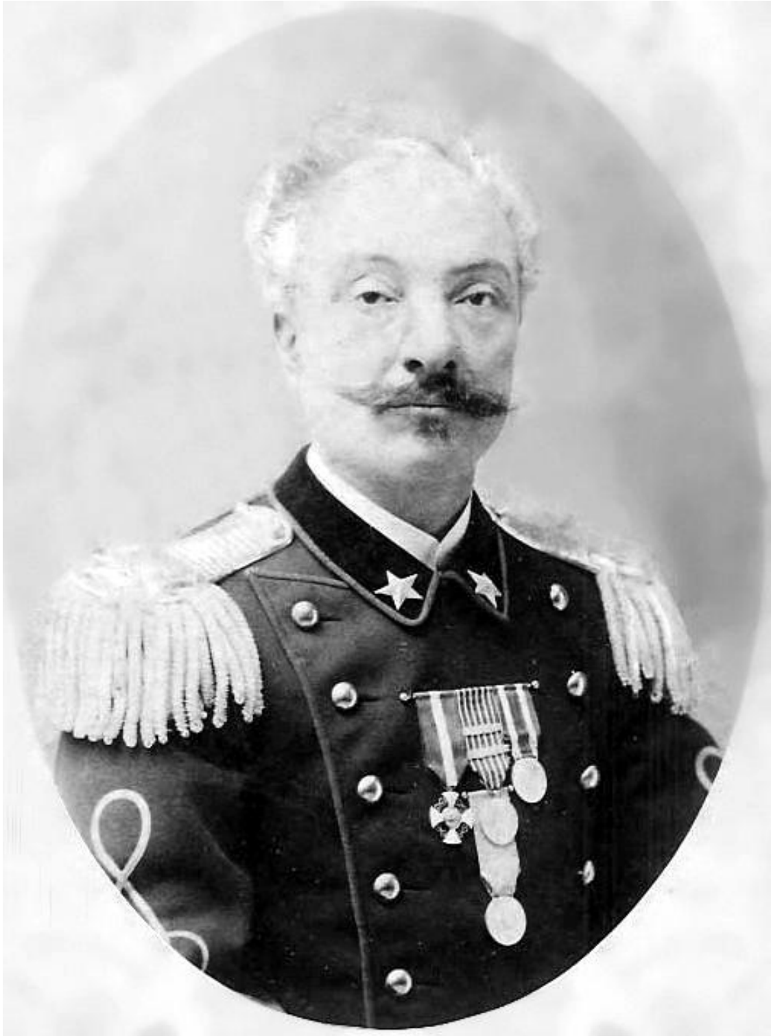
ፎቶ ቁ. ፳፡ ተነንተ ኮሎኔሎ ቶማሶ ደ'ክሪስቶፎሪስ ኮማንደርን 449 ጣልያንን፡ አብ ዶግዓሊ፡ መረብ ምላሽ፡ ብራስ አሉላ ተቐዝፉ። አብ ርእሲ አሉላ፡ ሕነፍዴታ "Vendeta Nazionale" ተኣወጀ። ጨለ አብርሃ ኮብላሊ፡ ነዛ ቨንዴታ ተበለጸላ።