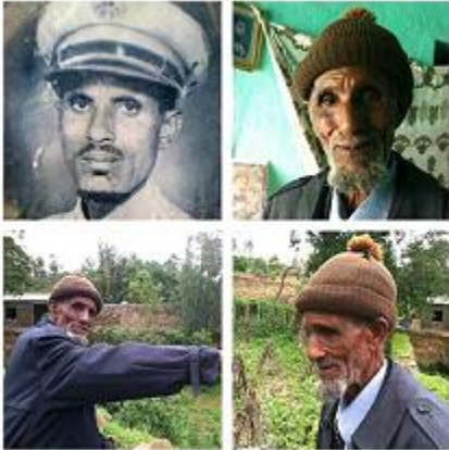
ኣቦይ ኣጽብሓኣቦ ማህደርን ሰነድን ዝኩኑ ኣቦ ኢዩም።ኣብ ዘለኻምዎ ፈጣሪ ጽላላ-የጽልለልኹም እብል።