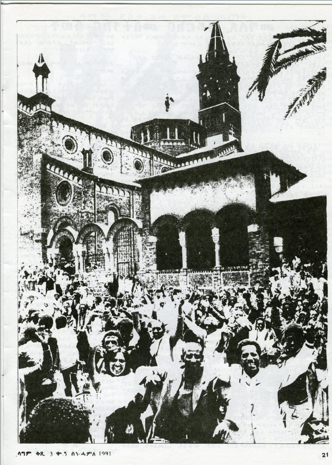
ሰገም ቅጺ 3 ቁ.5 ሰነድ ሰገም 1991

20 ሰነድ ናይ ፋሺስቲ መዓልቲ ካብ ጁን 1-18፣ 1991፣ ሽም ዝሰኣን ንህቢ ኣብ ኣሰመራ። ሽም ንህቢ ኣብ 19 ተቐልቐለ።