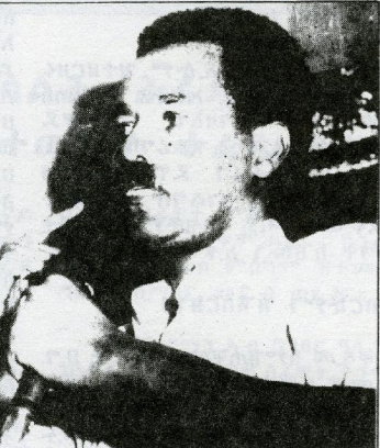
ብጻይ ኢሳያስ አፈወርቂ

እብዚ ዝሓለፈ መሪር ዘመን ሓርነታዊ ቃልሲና፡ ብባርባራዊ መግዛእታዊ ፖሊሲታትን ተግባራትን ቅጠባዊን ባህላውን ምዕባልና ዓንዩ፡ ህዝብና ተበታቲኑን ዓጃምታቱ መኺኑን ንድሕሪት ምጉታቱ ሓደ ካብቲ ዘሕዝንን ዘተሓሳስብን ጉጽዶ ኢዩ። መግዛእቲ ዘኸተሉ ዕንወት ጥራይ ከይኣክል፡ ደርቅን ካልእ ባህርያዊ ሓደጋታትን እውን ነቲ ሕሰም ኣጋዲድዎ ጸኒሎ ኢዩ። ነዚ ድርብ ማህሰይቲን ስንብራትን ንምስቃድ ዝሕተት ጸዓትን ስራሕን ግዜን ብቐሊሉ ዝግመት'ኳ እንተዘይኮነ፡ ሀግ.ሓ.ኤ. ድወንዘፍ ከይበለን ከይተሓለለን ዕማም ጸገመ ህንጻ ምጅማር ከም ኣገዳሲ ተልእኾ ኣሚምዎ ኣሉ።