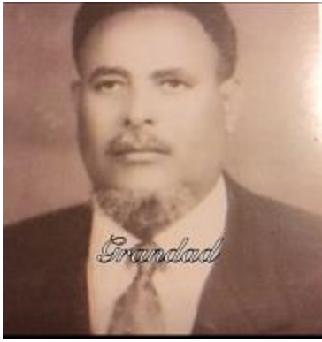
ፊተውራሪ ኣርኢያ ደበላይ-(ወላዲ)