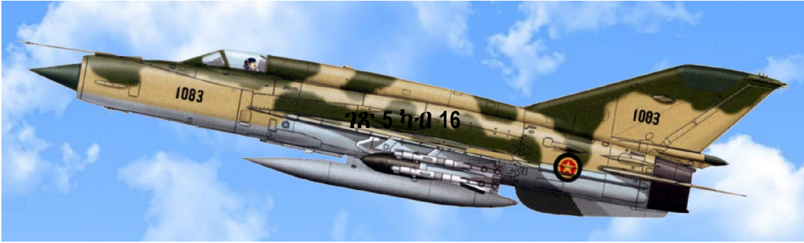
ጁን 6: 1998: ኮሎኔል በዛብህ ጴጥሮስ፡ ካብ መቐለ ኣብሪሩ ዘምጸኦ ሚግ-21 መለለዪ ቁጽሪ 1083 ነበረ።

ሚግ-21 መለለዪ ቁጽሪ 1083 ዝሓዘ ኮሎኔል በዛብህ ግን ናይ ሞቶ ኣለቃ እንደገና ታደሶ ሚግ-21 ሚሽና ኣብቂዖ፡ ናብ ዝመጸቶ መደበር ሓይሊ ኣየር መቐለ ገጸ ካብ ምርኢት ክሳብ ትስወር፡ ተተጠውዮ ብምምልላስ ግዜ ክቐትል ጸንሐ። ሞቶ ኣለቃ እንደገና ታደሶ ሽርብ ምስበለሉ፡ ኮሎኔል በዛብህ ተጠውዮ መጺኡ፡ ሚግ-ዕስራን ሓደኑ ኣብ መዕርፎ ነፈርቲ ኣስመራ ብምስጢር ኣዕለባ።