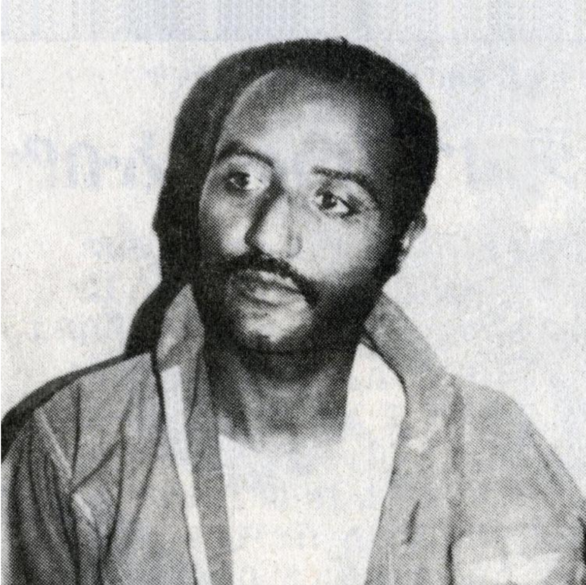
ሓቀኛ ምርኮኛ ፓይሎት ኮሎኔል በዛብህ ጴጥሮስ፡ ኣብ ኣፕሪል 20፡ 1984፡ ኣብ ጸጋማይ ክንፊ ናይ ግንባር ናቕፋ፡ ናይ ህዝባዊ ግንባር ሓርነት ኤርትራ፡ ናይ መጀመርያን መጨረሻን፡ ሓቀኛን እንኮን ኢትዮጵያዊ ምርኮኛ ፓይሎት ኮነ።

ኣብ ኣፕሪል 20፡ 1984፡ ፓይሎት ኮሎኔል በዛብህ ጴጥሮስ፡ ሚግ-23 ሓዙ ኣብ ጸጋማይ ክንፊ ናይ ግንባር ናቕፋ፡ ሳሕል ደብዳብ እናፈጸመ ከሎ፡ ተዋጋኢት ጀቱ ብናይ ህዝባዊ ግንባር ሓርነት ኤርትራ ናይ ጸረ ነፈርቲ ረሻሽ ኣሃዱታት ሞቶረኣ ተሃሪማ፡ ናብ መሬት ወዲቓ ተሓምሸሸት።