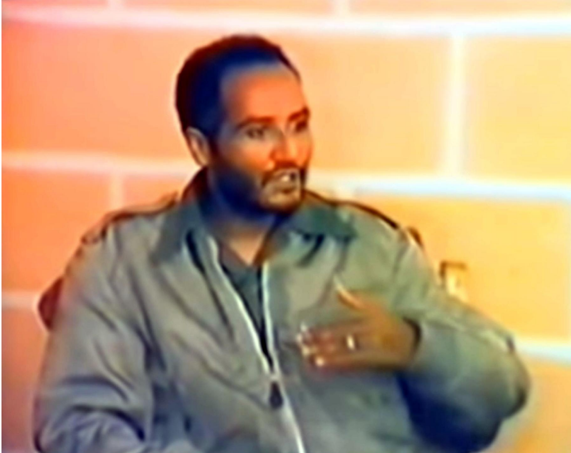
ዘይፐርፌክቶ ምርኮኛ ኣብ ሳሕል ኣብ ኣጸብዕቲ ናይ ቃል ኪዳን ወርቂ ቀለቡ ምስ ኤምኣይ-ካደ ናይ በረራ ጃኬቲ (MA-1 Flight Jacket)።