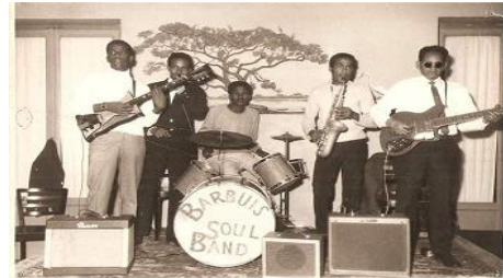
መራኽቦ ካብ ዝሓንጠጥክዎ ክፍልጥ ኢዩ።

ምስ ገለ ገዳይም ሙዚቀኛታትን ድምጻውያንን ይኹን ተመራመርቲ ብምልዛብ ድማ ካብ ገጻት ማሕበራዊ መራኽቦታት ጥራሕ ተሃጺሩ ዝተርፍ ኣብ ፍሉጥን ኣሳታፍን ዝኩነ መርቡብ ሓበሬታ ከም እኒ ቶጎርባ ዘይትልጥፎ ኢኻ ዝብል ሓሳብ ሰው ብምባሎም፣እነ ድማ ብዘይ ዝኩነ ተጎላባነት ነቲ ሓሳብም ብምርዓም እንሆ ብኸፊሉ መሪጸ ኤቕርቦ ኣለኹ።